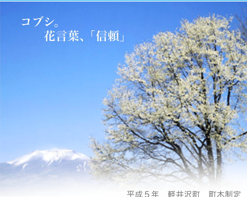
平成5年 軽井沢町 町木制定